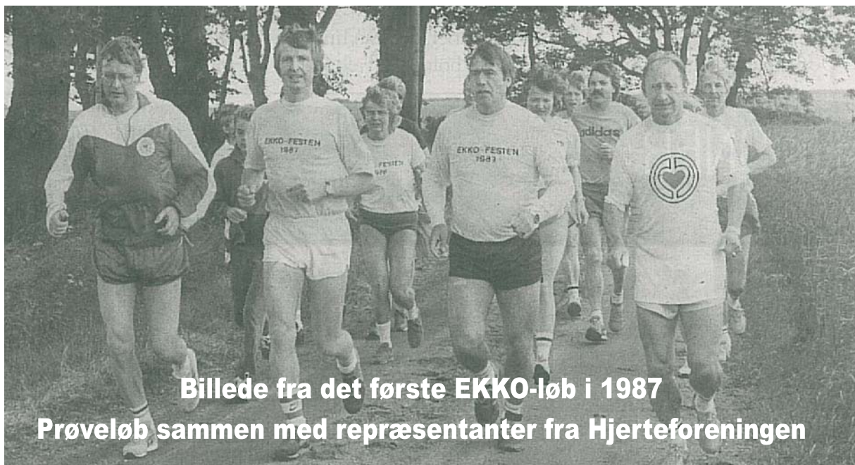
Billede fra det første EKKO-løb i 1987